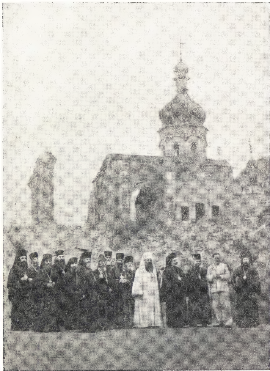
РУМЫНСКИЕ И БОЛГАРСКИЕ ГОСТИ В КИЕВО-ПЕЧЕРСКОЙ ЛАВРЕ